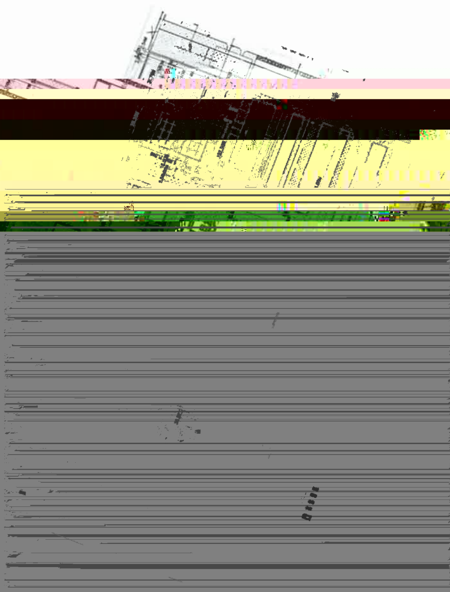
图 1 废水检测点位